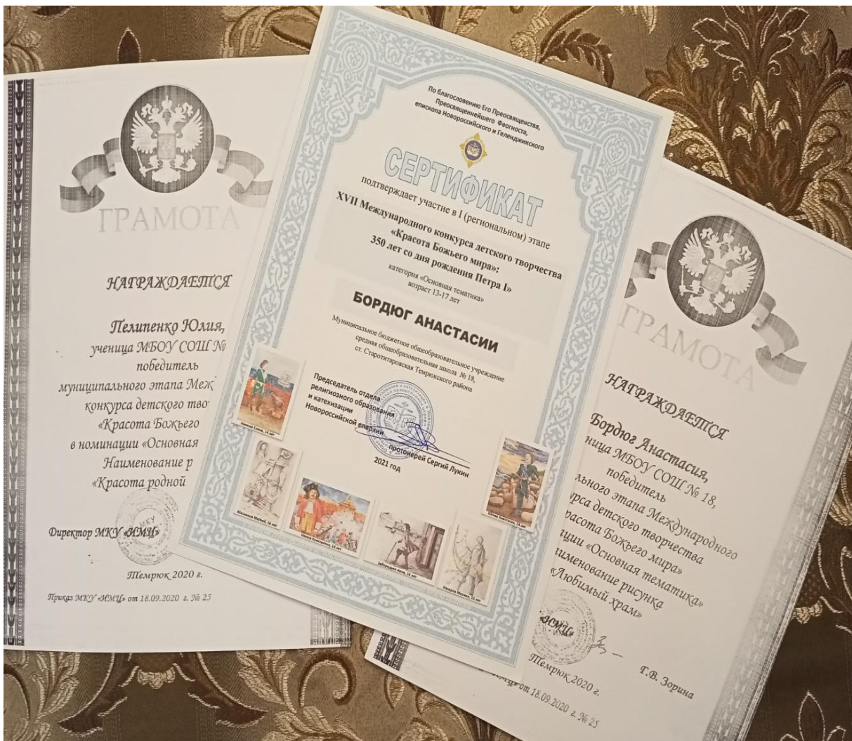
Участие в конкурсе «Красота Божьего мира»