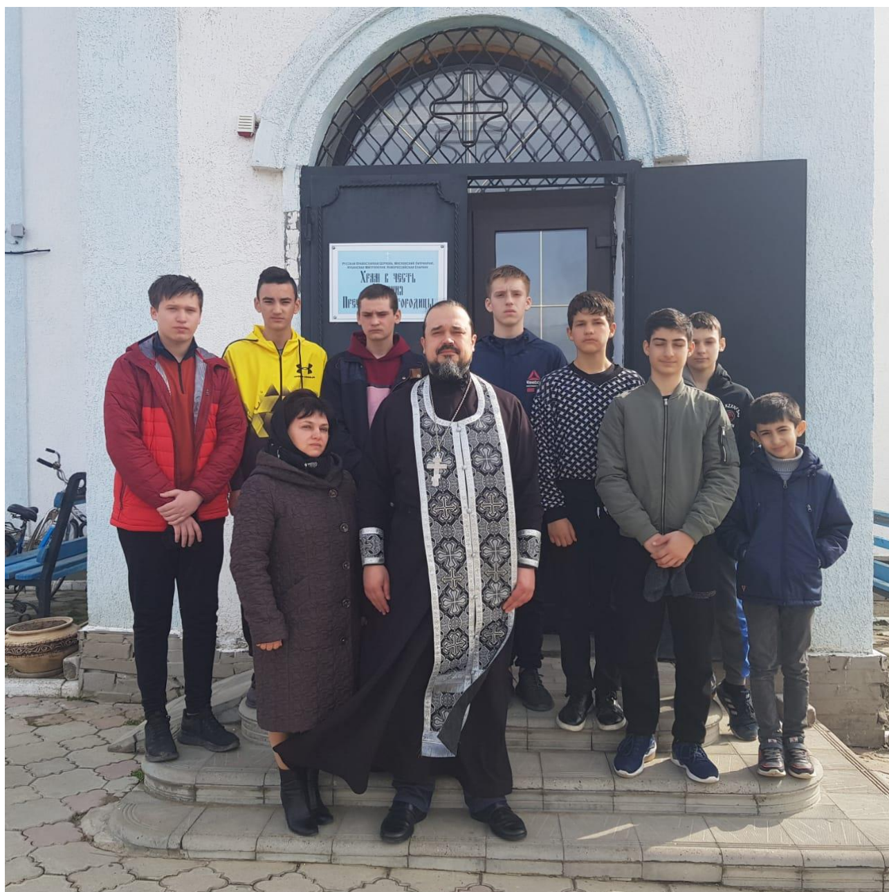
Посещение Храма Успения Пресвятой Богородицы ст. Старотитаровской