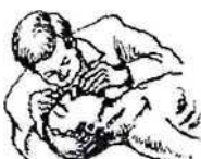
Проведение искусственного дыхания

Голову больного резко запрокинуть назад, положив под лопатки валик. Зафиксировать ладонями голову больного, выдвинув одновременно вперед его челюсть. Сделать глубокий вдох и максимально выдохнуть в рот больного, зажав пальцами его нос. Для эффективного дыхания необходимо 12 - 20 вдуваний в минуту.