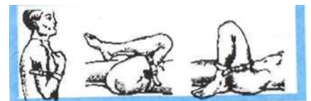
Фиксация конечностей в положении максимального сгибания

Кровотечение из артерий можно остановить, зафиксировав конечность повязкой в состоянии максимального сгибания.